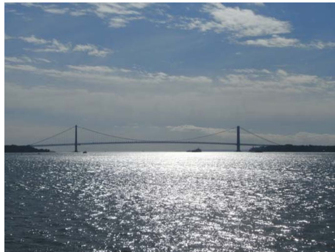
Verrazano Narrows Bridge

16.253 Frauen) setzten sich langsam in Bewegung und nahmen die zweigeschossige Verrazano Narrows Bridge sowohl auf der oberen, als auch auf der unteren Ebene gänzlich in Beschlag. Auf der gut 2 km langen Brücke angekommen (ich durfte oben laufen), blies ein eisiger Wind auf die Läufer­schar und ich sah zu, dass ich eher etwas geschützt in der Menge, als am äußeren und direkt dem Wind ausgesetzten Rand meinen Weg fand. Als Entschädigung für die heftige Abkühlung hatte man von der Brücke aus einen tollen, ersten Panoramablick auf die in weiter Ferne erstrahlende Skyline von Manhattan.