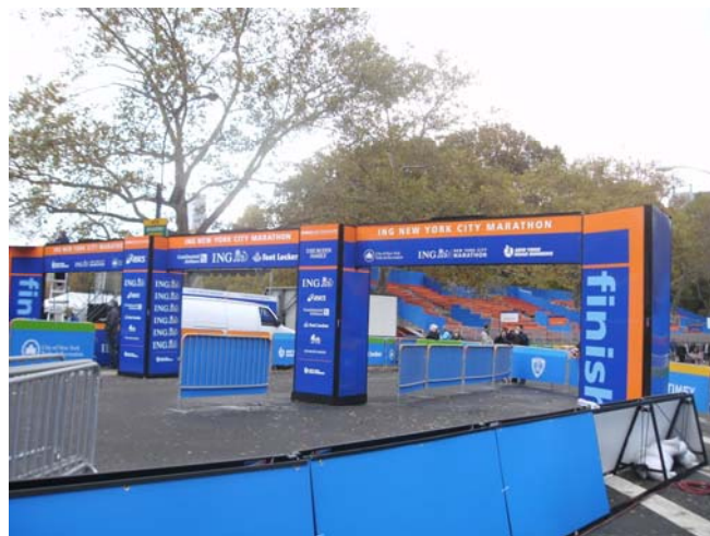
Ziel im Central Park