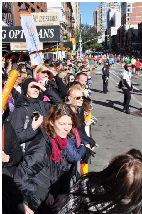
Zuschauer an der Strecke

Um meine Wunsch-Zielzeit von 3:30:00 Std. zu realisieren, musste ich im Durchschnitt 8:00 min./Meile (1,61 km) laufen. Noch auf der Brücke bei Meile 1 (1,6 km) angekommen, zeigte ein prüfender Blick auf das Zeiteisen 8:30 min. an, also war ich etwas zu langsam. Da die Verrazano Narrows Bridge aber gleich zu Beginn die größte Steigung der gesamten Strecke zu bieten hat, war die Zeit dafür schon in Ordnung. Trotzdem legte ich beim Tempo eine kleine Schippe zu, um ganz sicher zu gehen. Bereits bei Meile 3 (4,8 km) war ich 1 Minute unter meiner errechneten Sollzeit. Links und rechts entlang der Marathonstrecke säumten mehr als 2.000.000 Zuschauer die breiten Straßen und feuerten ununterbrochen die gigantische Läufer­schar an. Riesige Schilder mit „You look great“, „Come on, you can do it“ oder auch „Your feet hurt because you're kicking so much ass“ und „Run like you stole something“ wurden den Läufern zum Ansporn und zur Aufheiterung entgegengehalten. Zahlreiche Kinder standen am Straßenrand und streckten uns erwartungsvoll ihre Hände zum Abklatschen entgegen. Etliche Bands leisteten mit lautstarker Musik und unbeeindruckt von der Kälte, ihren Beitrag zu dem gigantischen Spektakel. Fünf New Yorker Stadtteile waren in den Marathon einbezogen.