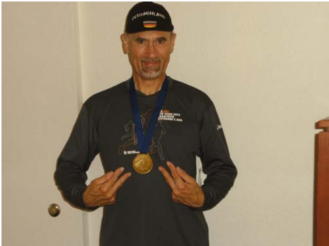
Die Finisher –Medaille

die angestrebte Zeit von 3:30:00 um fast 9 Minuten unterboten und meine bisherige Marathon-Bestzeit von 3:32:58 (Berlin 2008) pulverisiert und um über 11 Minuten unterschritten. Mit diesem Erfolgserlebnis und einem unglaublich guten Gefühl nahm ich kurz hinter dem Ziel mit stolzer Mine meine Finisher-Medaille entgegen. Anschließend begab ich mich zum weit entfernten UPS-Transportfahrzeug, um meinen Kleiderbeutel in Empfang zu nehmen. Auf dem Weg zum Hotel wurden die Läufer auch abseits der Marathonstrecke immer noch von unzähligen, wildfremden Passanten mit „Congratulations“ oder „You did a great job“ bejubelt und beglückwünscht. Meine Handschuhe hatte ich übrigens, weil sie so schön wärmten, bis ins Ziel anbehalten.