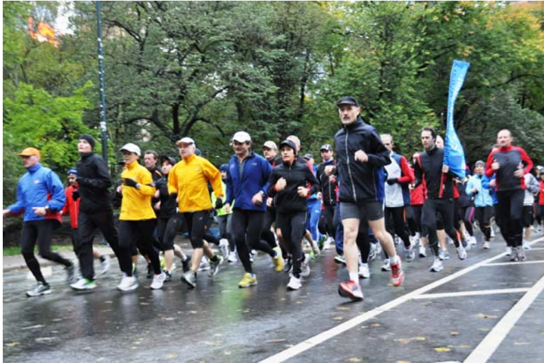
Trainingslauf im Central Park