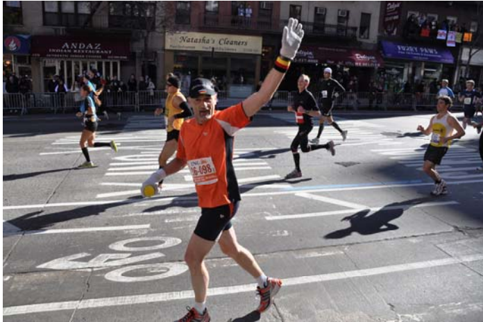
Fototermin bei Meile 17

Angefangen mit dem Start auf Staten Island, über Brooklyn, Queens, Manhattan, Bronx und zum Schluss noch einmal Manhattan mit dem eindrucksvollen Zieleinlauf im Central Park. Ebenso viele Brücken, nämlich 5 an der Zahl, mussten dabei überquert werden. Zuerst die bereits erwähnte gigantische Verrazano Narrows Bridge über die Meerenge The Narrows, gefolgt von der Pulaski Bridge welche über den Newtown Creek führt und der Queensboro Bridge über den East River von Queens nach Manhattan. Danach folgten noch die Willis Avenue Bridge über den Harlem River und die Madison Avenue Bridge, erneut über den Harlem River, zurück nach Manhattan. Ab Meile 3 reichten Freiwillige an jeder Meile Wasser und Gatorade in Pappbechern, wovon ich ca. jede 3. bis 4. Meile Gebrauch machte. Mittlerweile bei Meile 9 (14,5 km) angekommen hatte ich, bei gleichbleibender Geschwindigkeit, bereits 5 Minuten gutgemacht, ohne das Gefühl zu haben, zu schnell zu sein. Das Tempo war so also optimal und ich wollte es auch nach Möglichkeit so beibehalten. Zwischendurch gab es immer wieder Streckenabschnitte, von