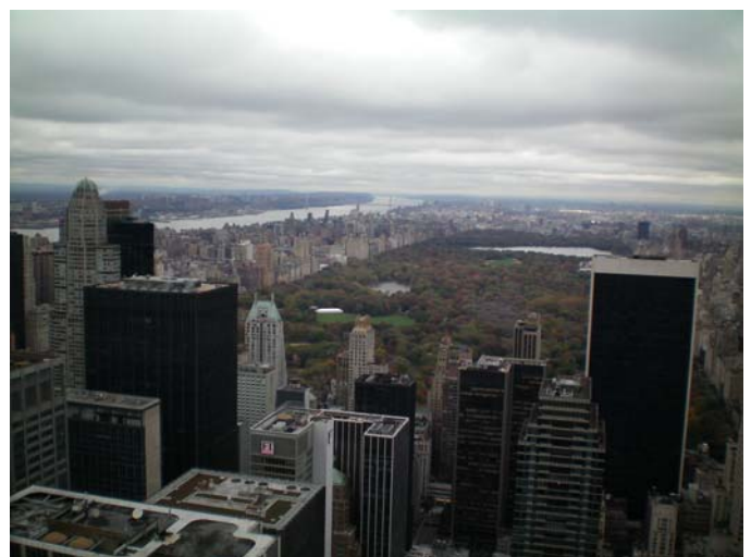
NYC Central Park aus der Vogelperspektive

Obwohl mein Tempo für meine Verhältnisse ziemlich flott war, blieb ein Leistungstiefpunkt, der sich bei einem Marathon in der Regel ab ca. 30 – 35 km einstellt, gänzlich aus. Auch Probleme oder Wehwehchen in Bezug auf die Beine, Füße, Knie oder Hüften, beziehungsweise Krämpfe gab es bei mir diesmal nicht zu beklagen, was sicherlich der guten Vorbereitung zu verdanken war. Dermaßen „gut drauf“ wurde auch der letzte Teil der Strecke locker abgspult. Die letzten 3,5 Meilen (5,6 km) bis zum Ziel führten durch den Central Park, vorbei an immer dichter gedrängt stehenden Zuschauern, die jetzt immer lauter zu werden schienen und ständig „you got it“ oder „good job“ schrien. Dermaßen von der tosenden Menge angefeuert, wurde man die letzten Meter, trotz einiger Steigungen, förmlich bis ins Ziel getragen. Bei Meile 26 angekommen, war das Ziel auch schon zu sehen und der Blick auf die Stoppuhr offenbarte eine, für diese anspruchsvolle Strecke, nicht im Traum erhoffte Zeit.