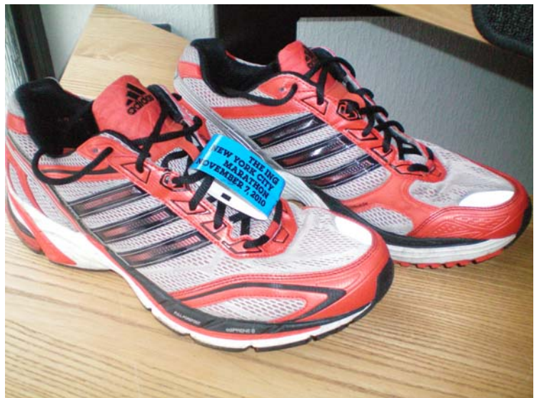
Zeitnahme-Chip (D-Tag) am Laufschuh

Am Abend vor dem großen Lauf füllte ich meine Kohlenhydratspeicher mittels einer großen Portion Pasta beim Italiener in Hotelnähe noch einmal so richtig gut auf. Außerdem bereitete ich alles, was für den großen Lauf benötigt wurde, sorgfältig vor und legte es griffbereit zurecht. So zum Beispiel dicke Kleidung für die Wartezeit in der Kälte vor dem Lauf, die Kleidung für den Lauf und den vorgeschriebenen, durchsichtigen Kleiderbeutel mit der Kleidung für nach dem Lauf. Außerdem die Startnummer sowie den Zeitnahme-Chip der am Schuh befestigt wurde, Getränkegurt mit ca. 1 Ltr. Flüssigkeit samt Power-Gel und Power-Riegel, Stoppuhr und Zeittabelle sowie etwas Pappe für auf den kalten Boden während der langen Wartezeit vor dem Start. Zusätzlich durfte ich nicht vergessen, alle Uhren ein zweites Mal von Sommerzeit auf Winterzeit (die Umstellung in Deutschland erfolgte ja bereits 1 Woche zuvor) umzustellen. So kurz vor dem großen Lauf machte sich nun langsam eine leichte Anspannung bemerkbar. Die folgende Nacht war geprägt von etlichen Wachphasen, in welchen alles zum x-ten male vor dem geistigen Auge ablief und letzte Entscheidungen getroffen wurden. So entschied ich mich, trotz vom Wetterdienst vorhergesagter kalter Temperaturen, mit einem kurzen Laufshirt und doch ohne Getränkegurt an den Start zu gehen. An Stelle des Getränkegurtes sollte eine ½-Liter Flasche für in die Hand genügen. Auf Power-Gel und Power-Riegel wollte ich nun ganz verzichten.