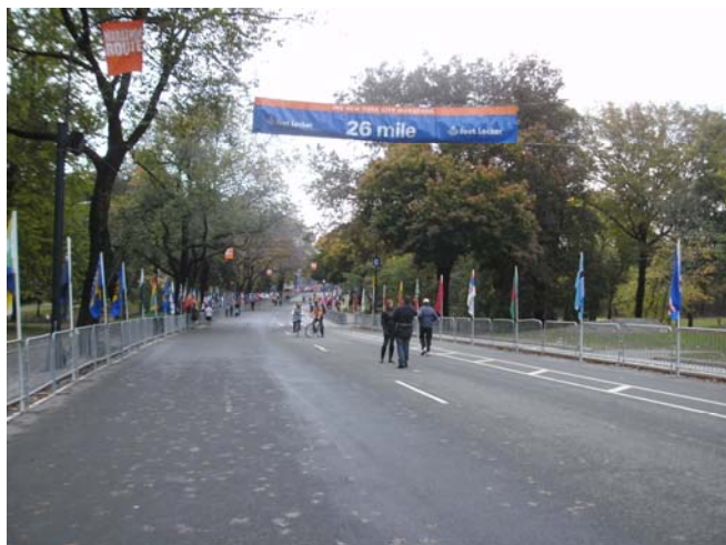
Meile 26 im Central Park

Dermaßen gut gerüstet und mit ca. 2600 Trainings – Kilometern und 5-6 kg Gewichtsabnahme, ging es am Donnerstag den 04.11.2010, 3 Tage vor dem gigantischen Ereignis, nonstop über den großen Teich nach New York City. Begleitet wurde ich von meiner Frau als Beobachterin des Geschehens und einem befreundeten Paar, er ebenfalls Marthonteilnehmer und dessen Frau auch als Zuschauerin an der Strecke. Vom zentral gelegenen Hotel in Manhattan, dem „Westin NY Times Square“, wurden noch am gleichen Tag die ersten Erkundungsgänge vorgenommen. So konnte man auch schon den bereits aufgebauten Zielbereich und die letzten beiden Meilen davor im Central Park begutachten. Außerdem sah man nun auch einen Teil der viel besagten Steigungen, die es kurz vor dem Ziel im Central Park noch zu bewältigen gilt. Auf der gesamten Marathonstrecke in New York sind immerhin unglaubliche 400 Höhenmeter zu überwinden.