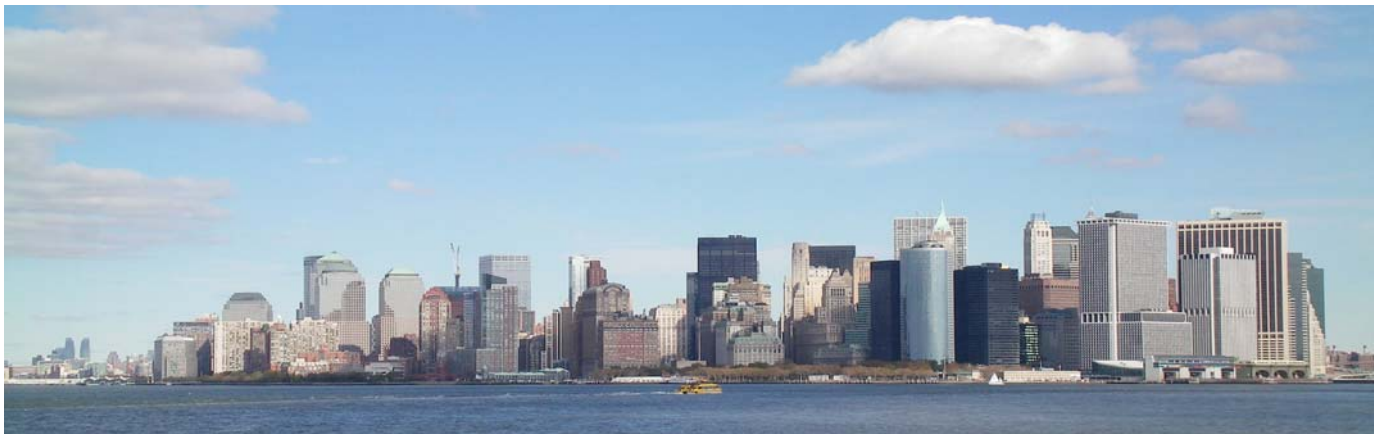
New York Skyline

Nach der erfolgreichen Teilnahme am 35. real Berlin Marathon 2008 gab es eigentlich nur noch eine Steigerungsmöglichkeit: Der ING New York City Marathon, die größte Laufveranstaltung der USA und weltweit der größte Marathon überhaupt. Da es ja im allgemeinen der größte Wunsch eines jeden Marathon - Läufers ist, wenigstens einmal im Leben am New York City Marathon teilzunehmen, lag nichts näher, als nach Berlin 2008 nun die Anmeldung für New York 2010 in Angriff zu nehmen. Der Grundstein dazu wurde bereits 2008 auf der Marathon – Messe in Berlin durch Registrierung bei interAir, einem Reiseveranstalter für weltweite Laufveranstaltungen, gelegt. Eine garantierte Teilnahme am ING New York City Marathon ist für Nicht-US-Bürger nur über ausgewiesene Veranstalter im Herkunftsland möglich, welchen nur ein sehr begrenztes Startnummern - Kontingent zur Verfügung steht. Einer dieser wenigen Veranstalter für Deutschland ist interAir. Anfang September 2009, also mehr als 1 Jahr im Voraus, folgte dann über den spezialisierten Laufreisen-Veranstalter interAir die schriftliche und verbindliche Anmeldung und Reservierung einer Startnummer für den ING New York City Marathon 2010. Eine derart frühe Anmeldung ist wegen der hohen Bewerberzahl (für 2010: über 120.000) unbedingt erforderlich, um überhaupt die Chance auf eine Teilnahme unter den auf 45.000 limitierten Startern zu erhalten. Der ING NYC - Marathon findet übrigens jährlich am ersten Sonntag im November statt, folglich am 07.11.2010.