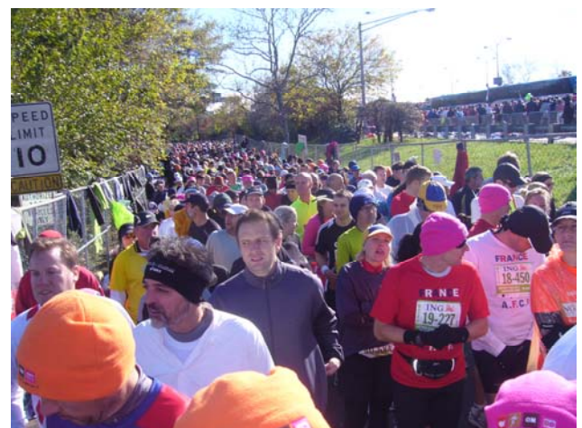
Aufstellung zum Start

Langsam schoben sich die drei, jeweils aus ca. 15.000 Läufern bestehenden Menschentrauben der Startlinie entgegen. Kurz vor dem ersten Start ertönte eine knappe Ansprache des Veranstalters über die Lautsprecheranlage, gefolgt von der mehrstimmig live gesungenen Nationalhymne. Nun flogen alle für den Lauf nicht mehr benötigten und bis dahin wärmenden Kleidungsstücke überall in hohem Bogen aus der auf den Start wartenden Masse. Meist auf die als Abgrenzung benutzten und dicht an dicht geparkten Busse. Auch ich entledigte mich der wärmenden Kleidungsstücke. Da waren eine lange, dicke Jeans, eine Regenjacke, eine dicke Strickjacke und ein dickes Sweatshirt. Die Handschuhe ließ ich an, um sie erst im Verlauf des Rennens, wenn die Hände durch die Bewegung entsprechend aufgewärmt waren, von mir zu werfen.