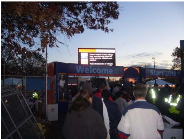
Eingang zum Camp Fort Wadsworth

begonnen zu haben. Beim aussteigen aus dem warmen Bus blies uns bei kalten 45 Grad F / 7 Grad C ein eisiger Wind ins Gesicht und alle marschierten zielstrebig Richtung Eingang Camp Fort Wadsworth. Nach Kontrolle der vorschriftsmäßig befestigten Startnummer und Inspizierung des vorgeschriebenen, durchsichtigen Kleiderbeutels wurde Einlass zum riesigen, weiträumig abgesperrten Camp gewährt. Das Camp war in drei Bereiche aufgeteilt. Einen orangen Bereich (Grete Waitz Village), einen blauen Bereich (Alberto Salazar Village) und einen grünen Bereich (Tegla Loroupe Village).