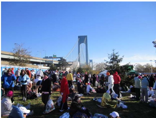
Warten im Camp Fort Wadsworth

Mittlerweile kam die Sonne langsam zum Vorschein, so dass meine Platzwahl auf eine Stelle fiel, welche die Sonne gerade so mit ihren ersten Strahlen erreichte. Ringsum ein reges Treiben, sowohl an den vielen aufgestellten Getränke- und Verpflegungsbuden, als auch an den unzähligen Toilettenhäuschen, die überall in großer Anzahl (insgesamt mehr als 1700) vorzufinden waren. Nachdem eine gute Stunde Aufenthalt im Camp Fort Wadsworth und einige Toilettengänge hinter mir lagen, begab ich mich gegen 8:30 Uhr zu dem mir zugewiesenen Corral, um dort die restliche Wartezeit bis zum Start zu verbringen. Leider lag dieser Bereich überwiegend im Schatten und die wärmenden Sonnenstrahlen blieben aus. Nach und nach füllte sich der abgegrenzte Bereich, bis schließlich die